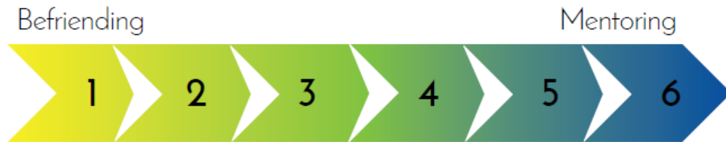
Figuur 2 Het befriending-mentoring spectrum (Amoroso et al., 2015)

Heel wat auteurs verwijzen naar dit spectrum (zie o.m. Amoroso et al., 2015; Cullen, 2006; Dolan & Brady, 2012); deze voorstelling geeft immers goed weer dat er enerzijds belangrijke verschillen zijn, maar dat het anderzijds geen louter zwart-wit verhaal is. Aan het uiteinde langs de befriending-zijde wordt gesteld: “the role of the volunteer is to provide, informal, social support. The primary objective of the relationship is to form a trusting relationship over time usually in order to reduce isolation and to provide a relationship where none currently exists. Other outcomes may occur e.g. a growth in confidence, but these are never set as objectives for the relationship”. Aan het andere uiteinde van het spectrum wordt ‘mentoring’ als volgt omschreven: “the role of the volunteer is to work with a client solely on agreed objectives which are clearly stated at the start. Each meeting focusses primarily on achieving the objectives and the social relationship, if achieved is incidental”. Tussen deze twee uiterste posities zijn nog vier tussenposities te onderscheiden, met telkens meer/minder nadruk op de relatie dan wel op de doelstellingen.